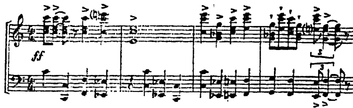
نموذج من السيمفونية ذات الثلاث حركات : لحن الاستهلال للحركة الثالثة .

أما الحركة الثالثة فنستهل بلحن جليل يقدمه الاركسترا بكامل أقسامه ويعود للظهور في ختامها . وتجسد الحركة ذاتها في بناء ثلاثي يمكن اعتبار أقسامه « تنويعات » على لحن الاستهلال وهي تتخذ صورة الفوجه fugue في القسم الثالث والأخير ، حيث يعالج المؤلف نفس اللحن الاستهلافي بأسلوب الفوجه الكنتراپنتي المتشابك . وهذا كله يدلنا على إصرار المؤلف على تجنب الصياغة التقليدية وتسلسل الحركات في كتاباته السيمفونية الناضجة . انظر النموذج الثالث